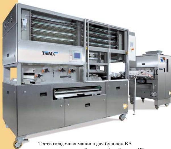
Тестоотсадочная машина для булочек ВА в сочетании с расстойным шкафом 3 минут G2

Такое оснащение позволяет изготавливать и отсаживать простые круглые тестовые заготовки, закатанное тесто или тесто с завернутыми краями, сдвоенные булочки, сайки или французские булочки.